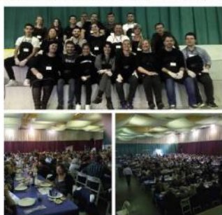
XIX Fideuà Popular 7.117.47€

Cada any organitzem diverses activitats que ja formen part del calendari popular, com són la Fideuà, la Recapta, el Sopar Solidari...o també la venda de Loteria de Nadal, la venda de braçalets... És amb aquests ingressos que podem continuar oferint un servei de qualitat amb el Projecte d'Atenció Psicosocial, Prèstec de material ortopèdic, Medicament Cost Zero, Hotel Cost Zero, Transport a centres sanitaris, dietes als centres sanitaris, entre d'altres serveis.