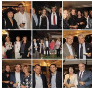
XX Sopar Solidari 6.680.60€