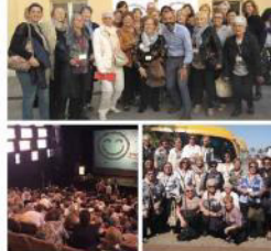
Jornada de voluntaris Barcelona 2017