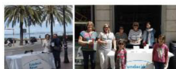
XVII Recapta Popular 5.465€