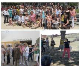
Dia de Voluntaris Roses 2017

Per tal de proporcionar el millor servei, la Fundació necessita el suport d'un gran grup de voluntaris. A part dels voluntaris que ofereixen els seus serveis professionals, també comptem amb voluntaris que ens ajuden a organitzar el gran nombre d'activitats que realitzem. A tots ells els oferim jornades de formació i també d'oci. Aquest 2017 hem comptat amb 149 voluntaris actius.