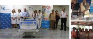
Venda de braçalets i Donatiu Llibre Articulat Hospital de Figueres